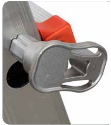
Poignée de blocage en fonte d'aluminium et acier inoxydable