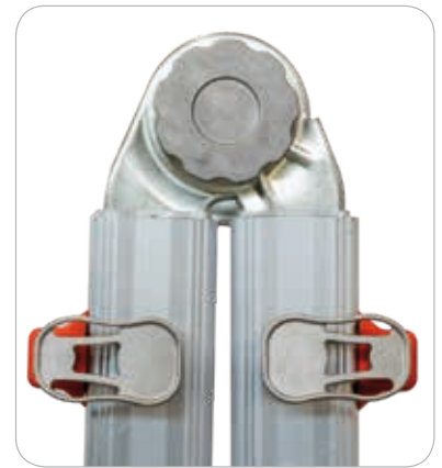
Articulation automatique en acier

Quatre fentes sur les montants et quatre patins mobiles, tous identiques, fixés par des goupilles non métalliques, dont deux fentes seront utilisées pour accueillir les épanseurs rapides.