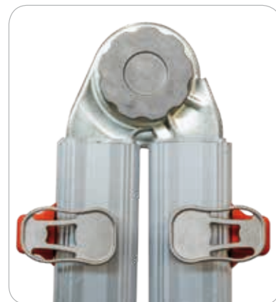
Bisagra automática de acero

Con cuatro aberturas en los montantes y cuatro zapatas móviles, todos iguales, fijadas con pasadores elasticos en plastico, dos de los cuales se utilizarán para acomodar los expansores rápidos.