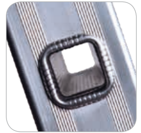
Peldaño seccionado cuadrado 30x30 mm

TÜV Italia Attestation of Conformity No.: D 027944 0026