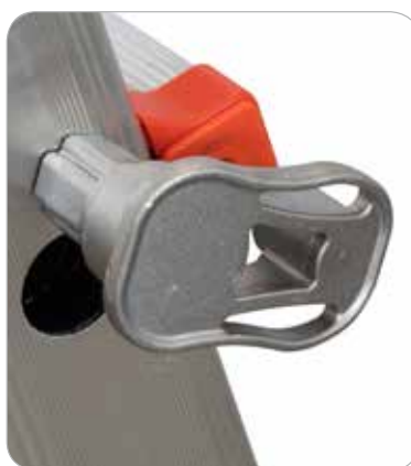
Tirante de bloqueo peldaño en aluminio fundido e inoxidable