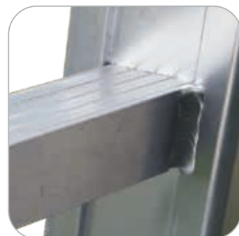
Liaison montant / échelon par sertissage et soudure supplémentaire