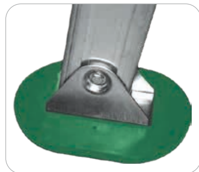
EN OPTION : Patin articulé ovale 16 x 11 cm en caoutchouc pour éviter l'enfoncement de l'échelle dans le sol