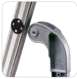
Articulation en fonte d'aluminium avec insert en polyamide pour éviter l'usure