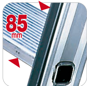
Marches en aluminium de 85 mm de profondeur, striées antidérapantes