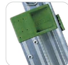
Glissière en acier recouverte de nylon