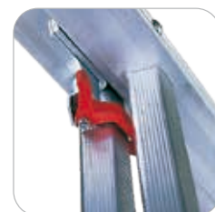
Verrouillage automatique anti- défilement (EN 131)