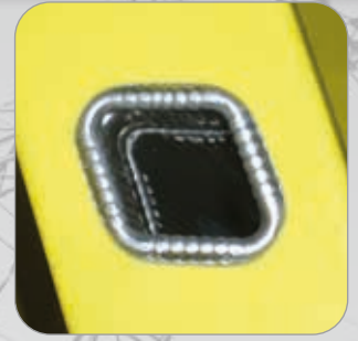
Echelon rhomboïdal 30 x 30 mm, permettant une utilisation optimale