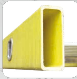
Montant fibre de verre. Echelon en aluminium