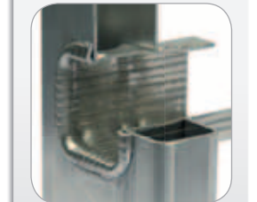
Zweifach geweitete und gebördelte Sprossen-Holm-Verbindung.