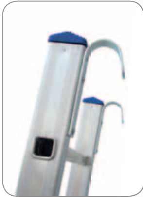
ZUBEHÖR: Einhängehaken-Set aus Stahl.