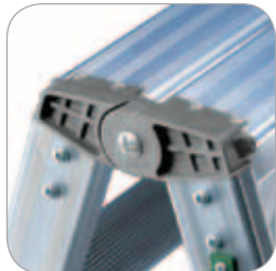
Scharniere aus Gussaluminium.